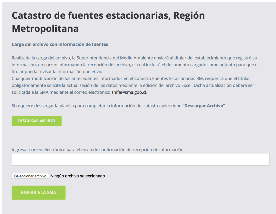
Imagen 4. Pantalla para cargar archivo con información del Catastro Fuentes Estacionarias, RM.

de establecimiento que desea catastrarse, que le permitirá ingresar al módulo para la carga de archivo, de acuerdo a lo indicado en la siguiente imagen: