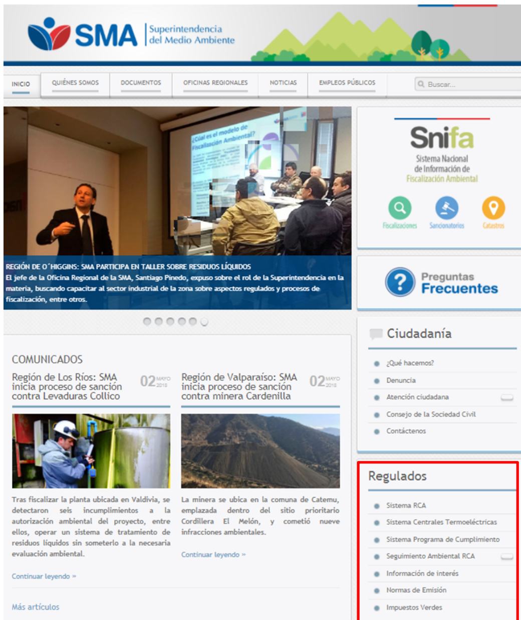
Imagen 2. Sección dentro de la página web de la SMA, donde se encuentra el link para carga y descarga de planilla Excel.

6.1 Para entregar la información de las fuentes por parte de titulares de establecimientos, se debe acceder mediante el siguiente link ( http://www.sma.gob.cl/index.php/catastro-fuentes-estacionarias-rm ) en la sección “Regulados” del sitio web de la Superintendencia del Medio Ambiente (ver imagen abajo).